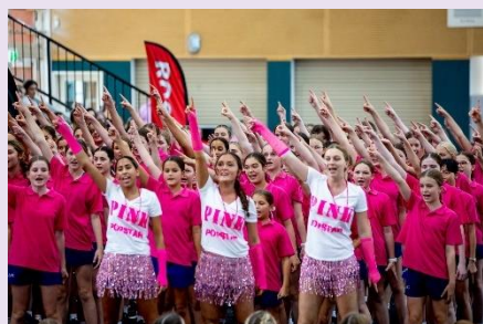
學院家庭啦啦隊比賽